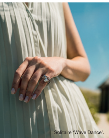
Solitaire 'Wave Dance'.